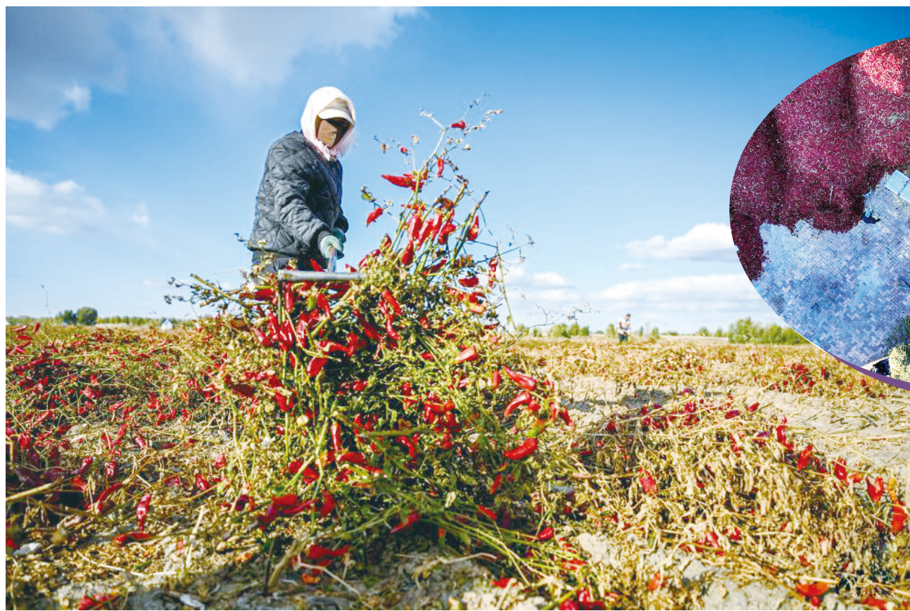
▲ 10 月 19 日，在通辽市开鲁县东风镇六合堂村，村民在田地里晾晒红干椒。